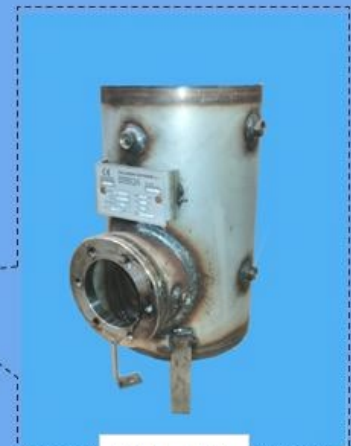
INOX Lt 16