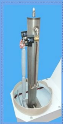
INOX Lt 6